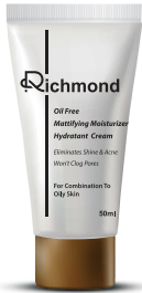
D COMBINATION TO OILY SKIN 50ml

✓ ترکیبات فعال: اسید هیالورونیک، روغن فندق، روغن آفتابگردان، مخمر هیدرولیز شده، روغن هسته زردآلو