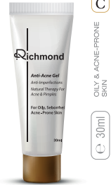
C ONLY & ACNE-PRONE SKIN 30ml

✓ ترکیبات فعال: زینک PCA، آلانتوئین، پروتئین هیدرولیز شده ابریشم، پروتئین هیدرولیز شده شیر، اولئانولیک اسید، گلیسیرین