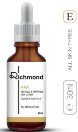
E ALL SKIN TYPES 30ml

✓ ترکیبات فعال: گلیکولیک اسید، اسید لاکتیک، اوره، لانونین، روغن دارچین، روغن های معدنی، عصاره چای